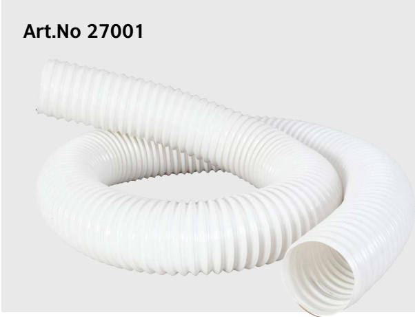
PVC Spiralschlauch (pro Meter) Tuyau spiral (per mètre) PVC spiral tubing (per meter)