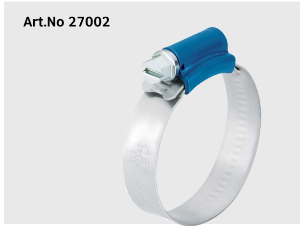
Schlauchselle (pro Stück) Pince pour tuyau (par pièce) Tubing clamp (per piece)